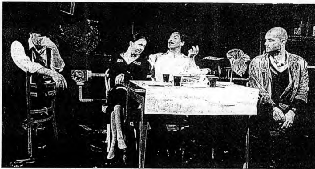
Ze hry „Zabiják Joe“ na jevišti u „Bezručů“