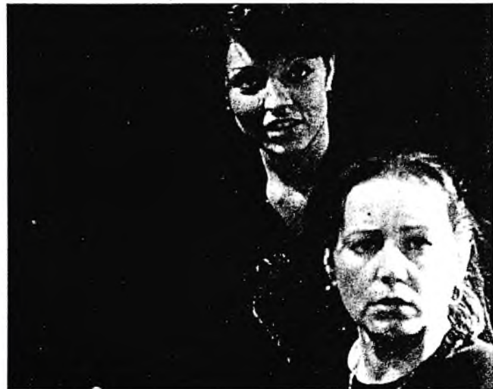
Téměř výlučně „ženské“ představení ostravské Divadelní společnosti Petra Bezruče Bernarda bylo uvedeno v Márnici.