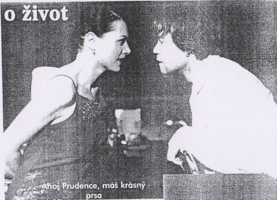
Ahoj Prudence, máš krásný prsa