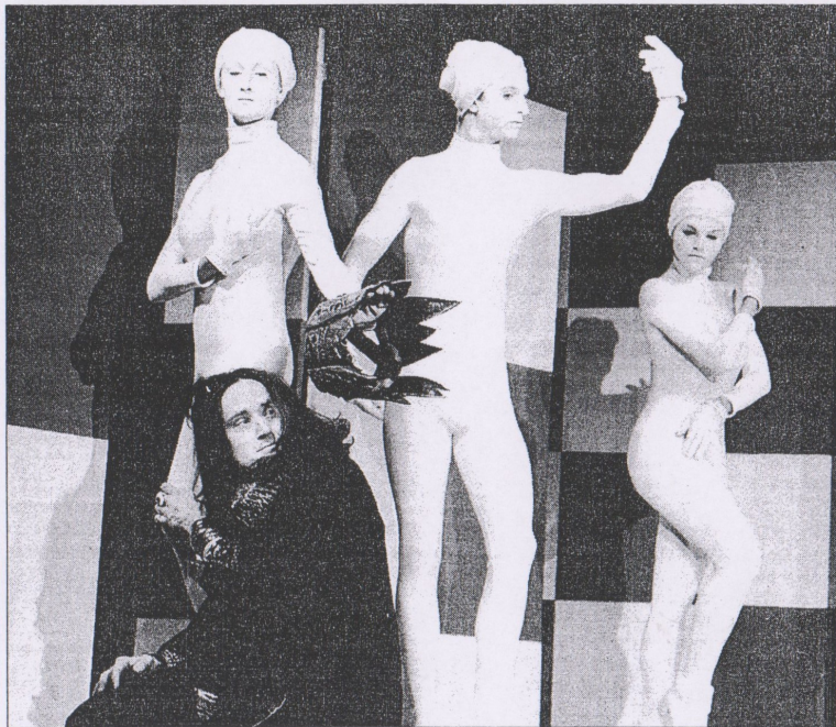
Divadelní společnost Petra Bezruče představí zítřka premiéru inscenace Zamilování ptáci v režii hostujícího Pavla Palouše

Premiéra inscenace se koná zítřka v sedm hodin večer.