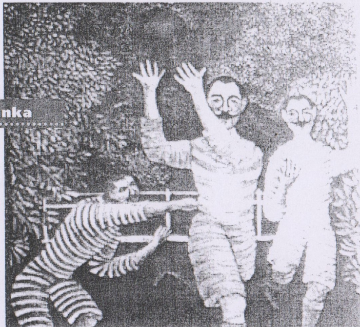
Z divadelního programu k inscenaci Rozmarné léto.