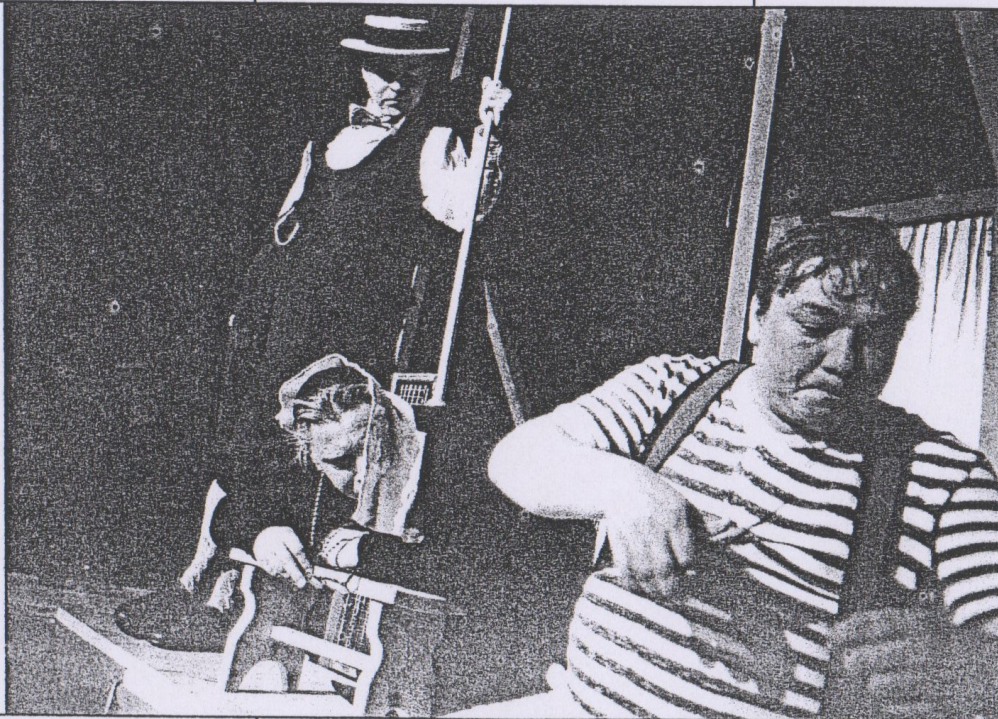
Rozmarné léto

ni“ (inscenováno Divadelní společností Petra Bezruče ve sklepení zvaném nikoliv Septik ale Márnice). Antidramatická satira o sugestivním líčení představ senilní generace vypadá provokativně. Kupodivu v ní však byla zastřena kontroverzní skutečnost, že se jedná o komentář mládí k náhrobku stáří (je to jen Márnice). Přemrštěné herectví, důraz na touhu po vyniknutí i při rýpání se v ucpaných záchodech z představení dělá podivně obscénní grotesku.