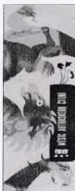
Měsíc autorského čtení Brno 1. - 31. 7.