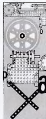
Festival Dream Factory Ostrava 3. - 6. 6.