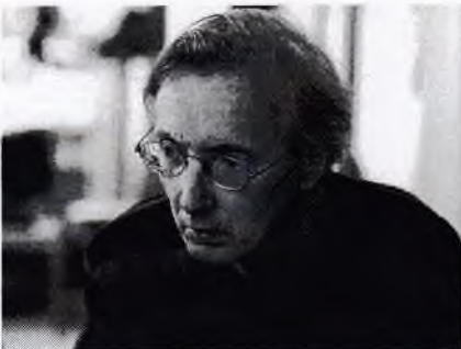
Režisér J. A. Pitínský