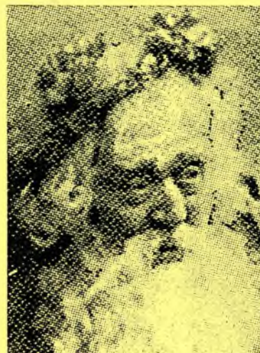
Vendelín Budil 1904