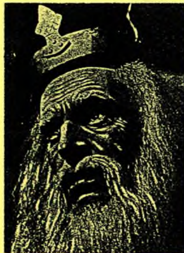
Laurence Olivier 1946