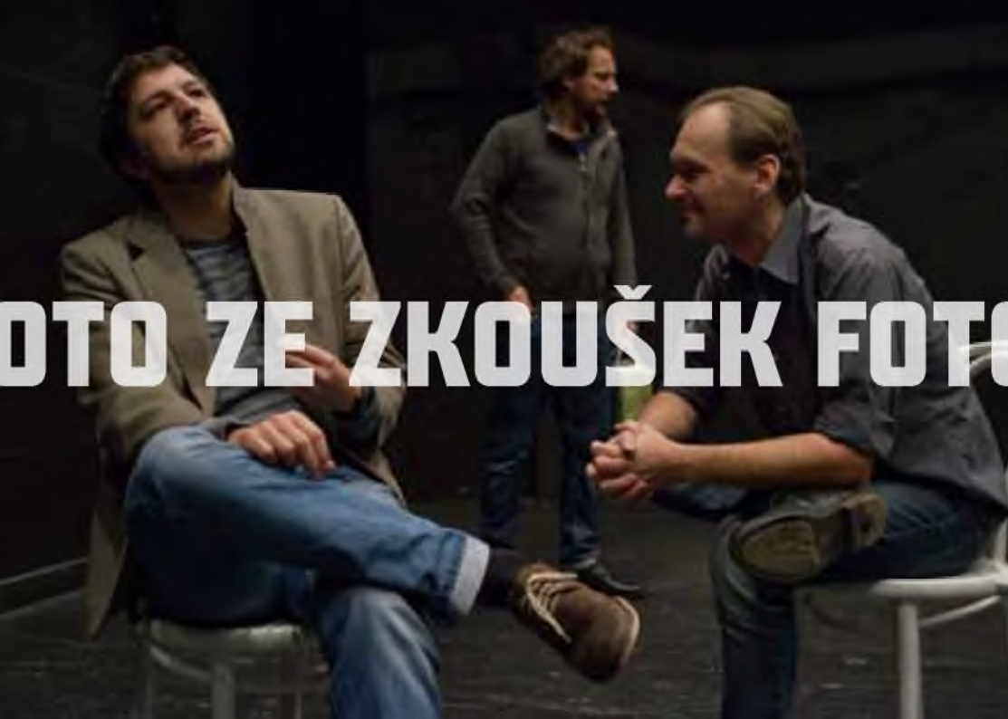
FOTO ZE ZKOUŠEK FOTO ZE ZKOUŠEK FOTO ZE