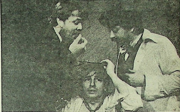
△ Dramatizaci Kafkova Procesu uvádějí v režii Pavla Cisoovského v Divadle hudby členové činohry Státního divadla v Ostravě a souboru Klíč.