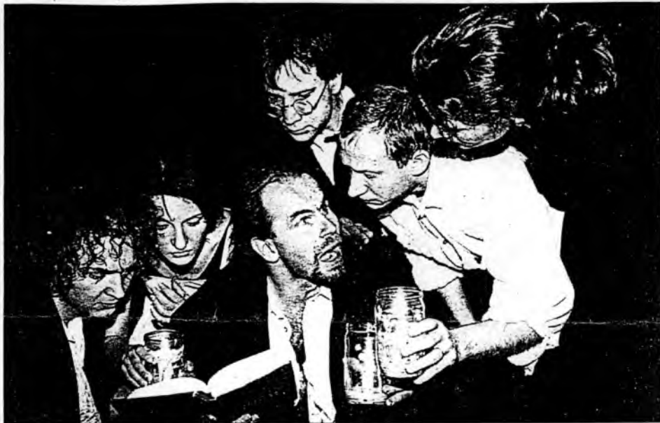
Z jevištní podoby Máje v ostravské Aréně

Ještě stále totiž u mnohých verš „byl pozdní večer, první máj...” okamžitě vyvolává zjednodušující asociace na „pěvce lásky”, který prostřednictvím hrdličky naléhavě zve „ku lásce”, za tichého přispění šeptajícího mechu. Nanejdvů se jim ještě vybaví „květoucí strom”, slavíkově zpěvavě vyznání voňavé růži, možná i libý závan borového háje. A to je tak asi vše, co jim paradoxně postačí k tomu, aby ventilovali svůj zájem o autora Máchových „Deníků”, který by se nad absurditou takto pojímané posmrtné popularity smál, až by se za břicho popadal. Vždyť ten – takovou triviální oblibou obdařený – úvod pouze otevírá ni-