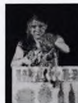
Velká Inventura Olomouc 17. - 27. 3.