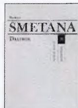
Bedřich Smetana: Dalibor