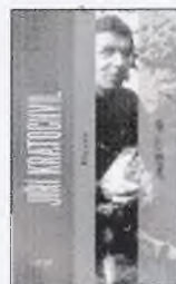
Jiří Kratochvíl Hry a sny