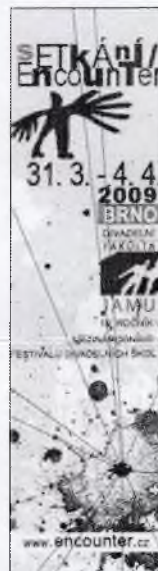
Festival Encounter Brno 31. 3. - 4. 4.